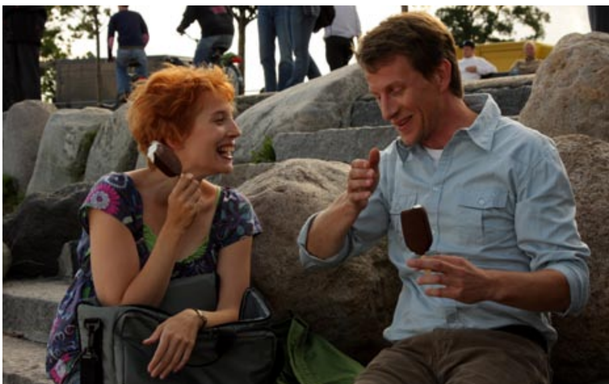
Toinen jalka haudasta