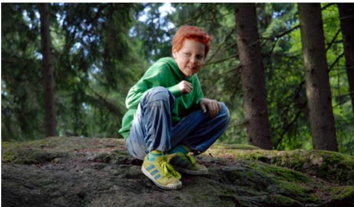
Risto Rämpääjä on vuoden 2008 katsotuin kotimainen elokuva.

Ruotsissa, Suomessa ja Norjassa paikalliset tekijät ovat saaneet kenties sysäyksen siitä, mitä muualla ajatellaan. Malmön ja Amsterdamin rahoitusfoorumeissa on ollut esillä useita kymmeniä kehittämissä olevia hankkeita, ja osa niistä on selvästi herättänyt yhteistuotantokiinnostusta ja edennyt kehittämissä.