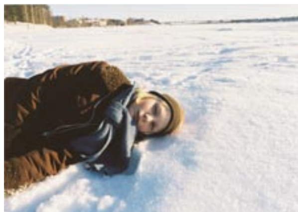
Tomas Alfredsonin Ystävät hämärän jälkeen oli yksi Oslon seminaarissa esitellyistä hankkeista.

Lapsiyleisön elokuvaan kohdistuu lähes kaikkialla tiettyä poliittista mielenkiintoa, mikä on rahoittamisen kannalta hyvä asia, mutta se voi olla myös kaksiteräinen miekka. Rahaa voidaan lupaila, ja olla kuitenkin antamatta. Velvoitteita voidaan antaa, mutta ei resursseja niiden toteuttamiseen. Tuotanto ja mediakasvatus voidaan sotkea pahan kerran keskenään. Voidaan törmätä ja usein törmätäänkin siihen,