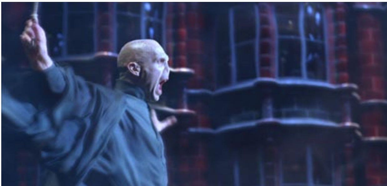
Harry Potter ja Feeniksin kilta