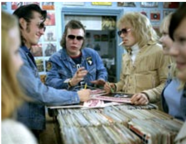
Ganes on Helsinki -filmin slatessa eli se on saanut sekä kehittelytukea että izi-tukea.