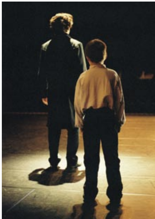
Visa Koiso-Kanttilan dokumenttielokuva Talvinen matka sai ensi-iltansa DocPoint-festivaalilla tammikuussa. Elokuva on saanut Median hankekehittelytukea.

Slate funding 2: Tuotantoyhtiö on oikeutettu hakemaan tukea, jos se on tuottanut vähintään kaksi MEDIA-ohjelman genreihin (fiktio, dokumentti,