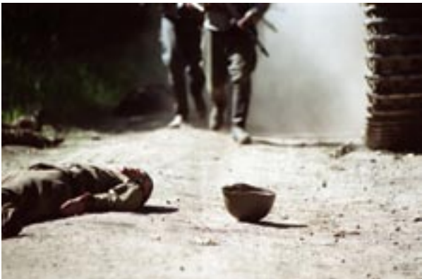
Tali – Ihantala 1918