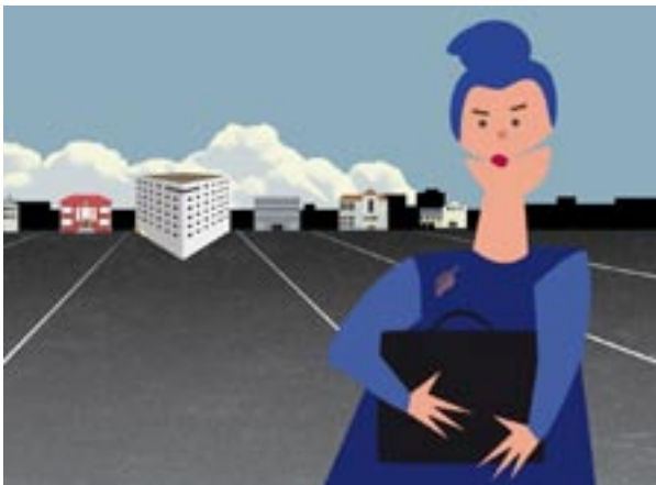
Viisi aamua vielä