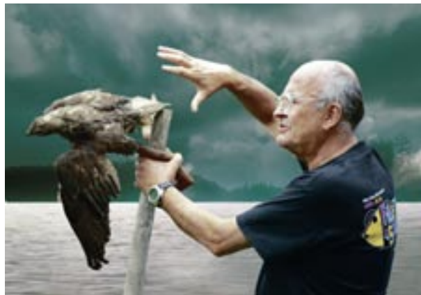
Ei kukaan ole saari