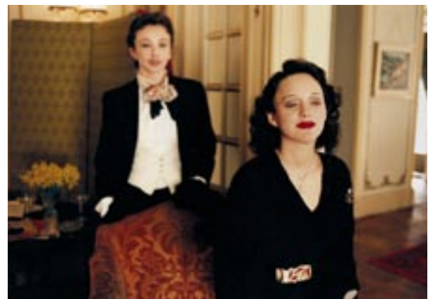
Olivier Dahanin La Môme ( La Vie en Rose )-elokuva Edith Piafista nähtiin Berliinin elokuvajuhlien avajaiselokuvana. Elokuva on saanut Median levitystukea.

Ohjelma käynnistyi oikeastaan jo viime vuoden puolella, kun uuden ohjelman ensimmäiset hakukierrokset julkaistiin virallisessa lehdessä. Käytännössä Media 2007 lanseerataan juhlapuhein, maljoihin ja tiedotustilaisuuksin Berliinin elokuvajuhlilla helmikuussa. Tässä yhteydessä on mukava todeta, että Berliinalen virallisten sarjojen elokuvista peräti 18 on Median tukemia. Lisäksi peräti neljä viidestä ei-eng-