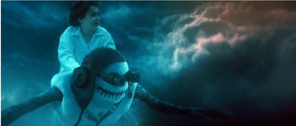
Kuva 1. Kuvakaappaus Nightwish-elokuvasta Imaginaerum (Solar Films Inc. 2012b).

Suomalaisiksi rahoittajiksi elokuvan lopputeksteissä on mainittu Suomen elokuvasäätiö, televisiokanavaa edustava Nelonen Media ja levittäjä Nordisk Film. (Solar Films Inc. 2012a.) Näiden lisäksi tuotannon yhteistyökumppaneiksi on mainittu kanadalaiset Québec – Production Services Tax Credit ja Canada – The Canadian Film or Video Production Tax Credit. Selvitän kappaleissa 4.2 ja 4.3 mikä näiden kanadalaisten rahoittajien rooli on ollut ja mitkä seikat ovat vaikuttaneet siihen, että kaikki nämä rahoittajatahot on saatu tuotantoon mukaan.